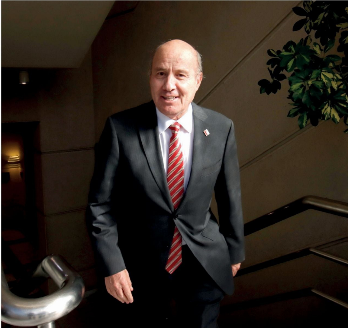
► Ministro de Hacienda, Jorge Quiroz.

de pesos. Donde se sugiere avanzar con mayores recortes es en Salud. El oficio apunta a discontinuar 25 programas. Entre ellos, se incluye suprimir el plan Acceso a la Atención de Salud a Personas Migrantes, Elige Vida Sana, el Plan Nacional de Demencia, el Programa Odontológico Integral, el Programa de Apoyo a la Identidad de Género, el Programa de Reparación y Atención Integral de Salud (PRAIS), el Programa de Salud Trans y el Programa Nacio-