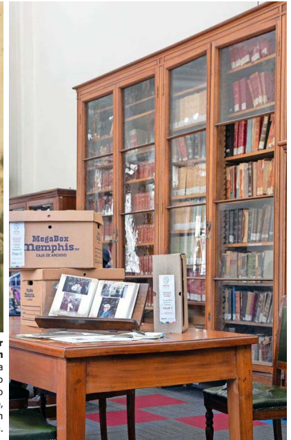
Las tres cajas con documentos familiares están disponibles para el público en el Archivo Nacional.

De algún modo, lo hicieron. Sus trayectorias, sus obras, sus ideas son parte de una historia conocida. Lo que faltaba era esto: el origen. S