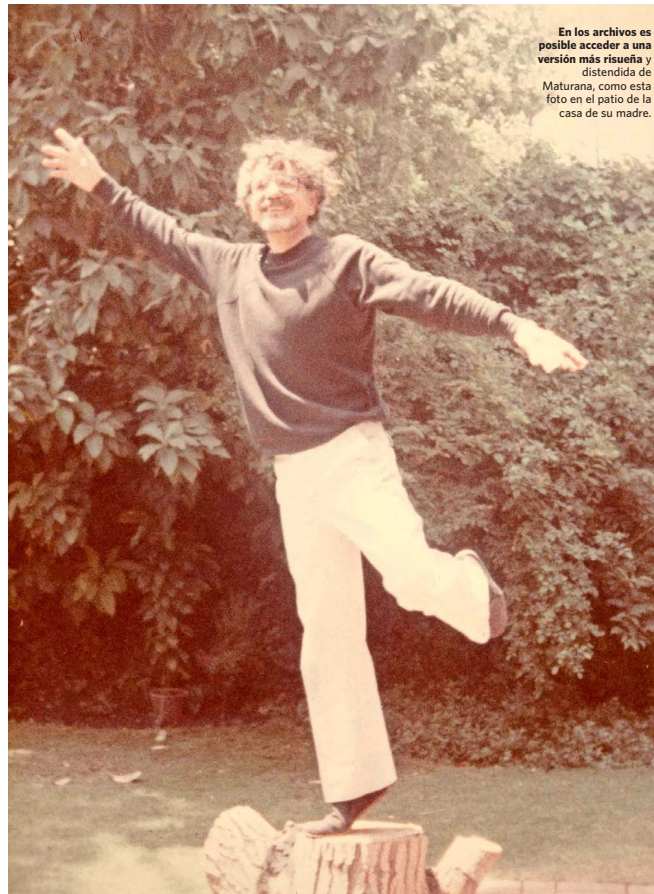
En los archivos es posible acceder a una versión más risueña y distendida de Maturana, como esta foto en el patio de la casa de su madre.