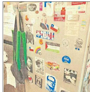
Imágenes de naturaleza política pegadas en la cocina de la casa de uno de los estudiantes indagados por violencia estudiantil.