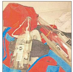
Preparación de molotov por parte de investigados. Entre otras diligencias, investigadores revisaron el teléfono de imputados.

“ Si bien se han observado avances en ciertas medidas administrativas y legislativas, el desafío sigue siendo lograr una agenda que combine adecuadamente control y prevención, con foco en evidencia”.