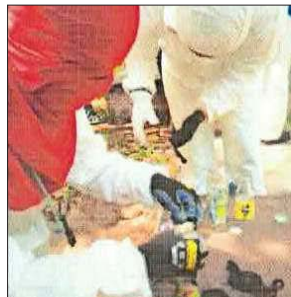
Imputados guardaban en teléfonos evidencias de molotov que sirvieron de pruebas en su contra en investigación penal.