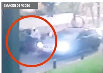
Empresario ferretero (84) fue secuestrado en barrio residencial de San Miguel.

Los victimarios esperan negociar un millonario rescate. En ambos casos, llama la atención la vinculación con lo que estos grupos criminales actúan y su "osadía", al actuar en la vía pública. También la capacidad logística de contar con vehículos para el traslado del "objetivo" y el uso de armas de fuego, comentan investigadores. Igualmente, la cantidad de personas involucradas, ya que en el delito que iba a la baja, al menos en los primeros seis personas, presuntamente extranjeras. Mien-