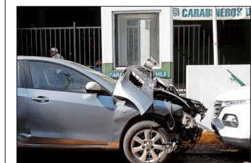
En la imagen, el auto conducido por un carabinero —ahora dado de baja— que protagonizó un violento choque, en el que falleció una joven de 20 años.

Preocupa a la policía y expertos la eventual reactivación de este fenómeno, luego que las últimas estadísticas de la fiscalía dieran cuenta de que era un delito que iba a la baja, al menos en los primeros meses de este año, en comparación con 2025.