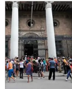
A la falta de electricidad y combustible en Cuba se suma la escasez de efectivo en los bancos, como lo atestiguan las largas colas, principalmente de personas mayores, que por horas se agolpan ante las sucursales. | A 6