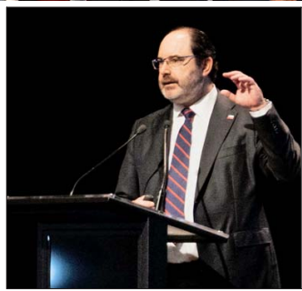
Ministro Rau en el encuentro.