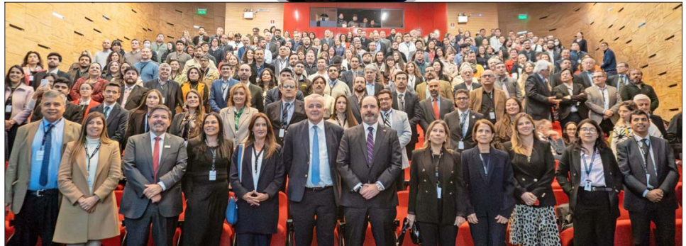
Público del encuentro en la sede Valparaíso de Duoc UC.