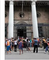
A la falta de electricidad y combustible en Cuba se suma la escasez de efectivo en los bancos, como lo atestiguan las largas colas, principalmente de personas mayores, que por horas se agolpan ante las sucursales. | A 6