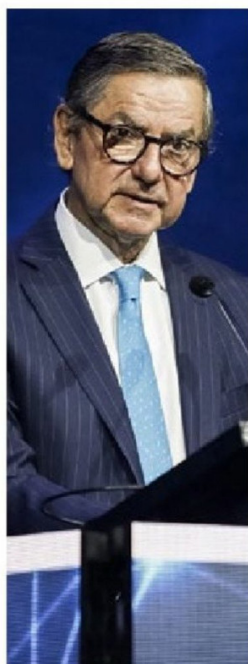
Pablo Granifo preside Banco de Chile y Quíñenco.