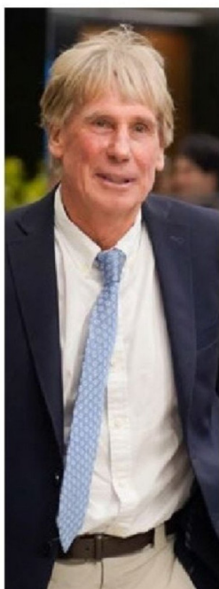
Hernán Büchi está en SQM y Quíñenco.