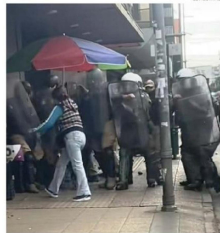
EN LA INTERSECCIÓN DE ALDUNATE CON PORTALES SE PRODUJERON LOS INCIDENTES MÁS GRAVES.