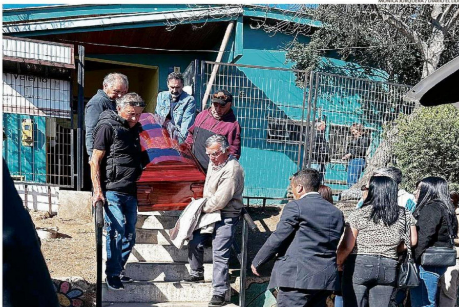
EL TRIPLE FUNERAL SE LLEVÓ A CABO LA TARDE DE AYER LUEGO QUE LA FAMILIA FUERA VELADA EN LLOLLEO ALTO.