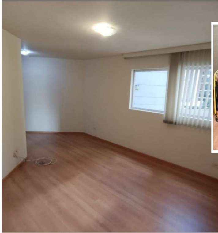
El acceso del departamento ya anuncia a los visitantes que sus espacios son poco convencionales.

"Me choca mucho, pero he visto mucho en Curitiba que los departamentos están como quebrados. No son como Tetris como en Chile, donde todos tienen los pasillos rectos. Acá tú puedes sentir que doblas incluso en el pasillo. Hay muchos espacios