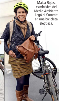
Maisa Rojas, exministra del Medio Ambiente llegó al Summit en una bicicleta eléctrica.