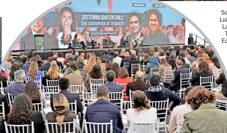
Más de 500 asistentes participaron de manera presencial de la primera jornada del Summit Futuro Sostenible 2026 y cerca de 370 mil visualizaciones se contabilizaron desde Emol TV.