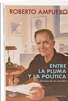
El nuevo libro del excanciller.

autoridad y prestigio que la organización tuvo. Hay un consenso amplio en ese sentido y en el sentido de que la humanidad necesita una institución donde encontrarse.