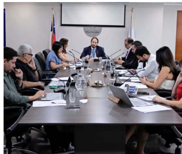
Concejo municipal de Huechuraba.

Según los datos que enviaron, a la conceja-