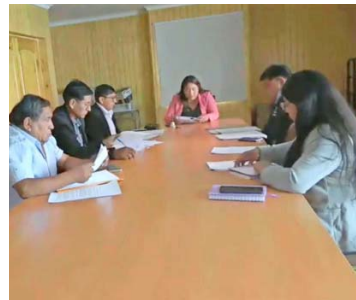
Concejo municipal de Camiña.