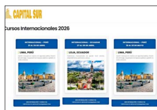
Los cursos ofrecidos en la web de Capital Sur.

En 2024, el Observatorio de Chile Compra —departamento de la institución que monitorea permanentemente los procesos de compra y