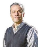
HUBEMPRENDE | Pág. 12

Columna de Óscar Landerretche: “Tutti Frutti”