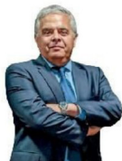
OPINIÓN | Pág. 5

Columna de Ricardo Escobar: “Impuestos y decisiones de inversión”