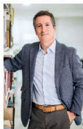
ENTREVISTA | Pág. 10

La agenda del jefe de Corfo: más IA, menos hidrógeno verde