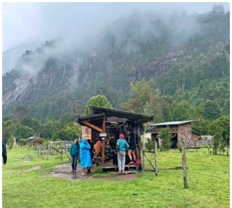
LA JUNTA. En este lugar se registran quienes vienen a acampar y escalar. Los servicios son básicos, pero funcionales.