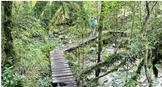
OBRAS. Estos puentes, hechos por los propios arrieros, llevan años resistiendo el duro clima y el paso de los caminantes.

El trabajo no es menor. El Centro de Visitantes funciona sin cobro por acceso. Eso implica que cada año deben recaudar millones fuera de temporada para sostener su operación. ¿Cómo? Principalmente, con el aporte voluntario que dejan las personas.