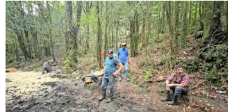
LABOR. Algunos arrieros del valle de Cochamó han sido declarados "Tesoros humanos vivos". Hoy trabajan por la conservación.