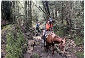
APOYO. Para no cargar peso en la ruta, está la opción de contratar un pilchero, lo que debe coordinarse con anticipación.