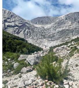
GRANITO. Las paredes de Cochamó han alcanzado fama mundial para la escalada.