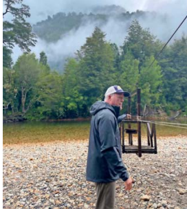
MEDIO. Estos carritos sirven para cruzar el río Cochamó con mayor seguridad.