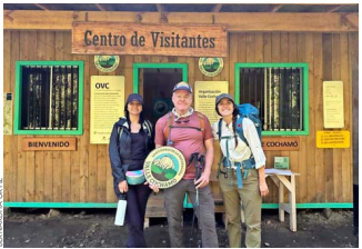
ENTRADA. En el Centro de Visitantes realizan una breve charla de introducción. Se sustenta con los aportes voluntarios.