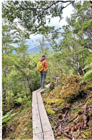
Sendero al cerro Vigía.

POR Gabriela Espejo , DESDE LA REGIÓN DE AYSÉN.