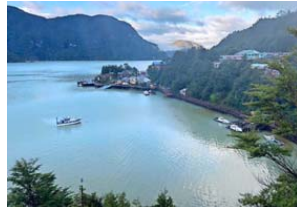
Desde el mirador El Faro.