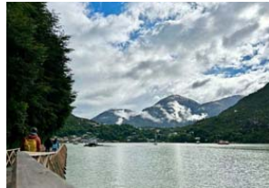
Caleta Tortel, visto desde el sur.