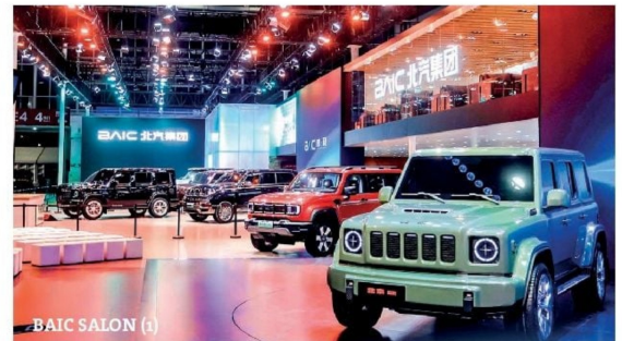
BAIC SALON (1)