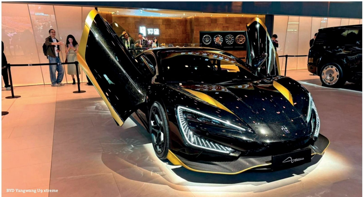
BYD Yangwang U9 xtreme

Geely, uno de "los cuatro grandes chinos", estrenó novedades de sus