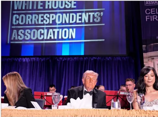
TRUMP ESTABA en la cena de corresponsales de la Casa Blanca cuando ocurrió todo.

El FBI dijo que habían capturado a un sospechoso tras lo que describió como "un incidente de tiroteó". Trump también informó que el sospechoso fue captu-