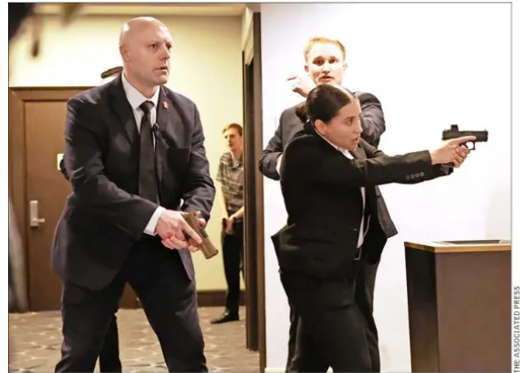
AGENTES del Servicio Secreto respondieron rápidamente ayer.