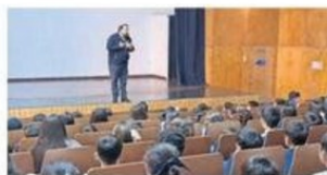
EL FISCAL EN LA REUNIÓN.

“La actividad resultó tremendamente útil, por lo que agradecemos el interés del re-