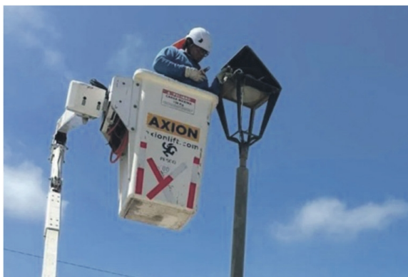
La iniciativa será financiada por fondos del Royalty y busca mejorar la seguridad en el lugar. EL DÍA

El municipio impulsa una nueva iniciativa para ampliar luminarias, reparar calzadas y renovar veredas en el principal acceso entre Las Compañías y el centro, que se suma al mejoramiento de áreas verdes actualmente en licitación con financiamiento PMU.