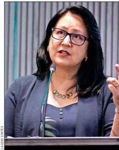
La contralora general de la República, Dorothy Pérez.

ca una revisión profunda y sería de todos los antecedentes asociados a estos decretos. Nuestro objetivo como Gobierno es que estos proyectos efectivamente se desarrollen, utilizando los instrumentos que establece el marco legal vigente y otorgando certeza a los inversionistas que han creído en nuestro país. Debemos aprovechar el siguiente ciclo del litio, porque el anterior no se aprovechó", indicaron, ante la objeción de la Contraloría de la toma de razón del contrato de litio de Quillagua Norte. También señalaron que "cada