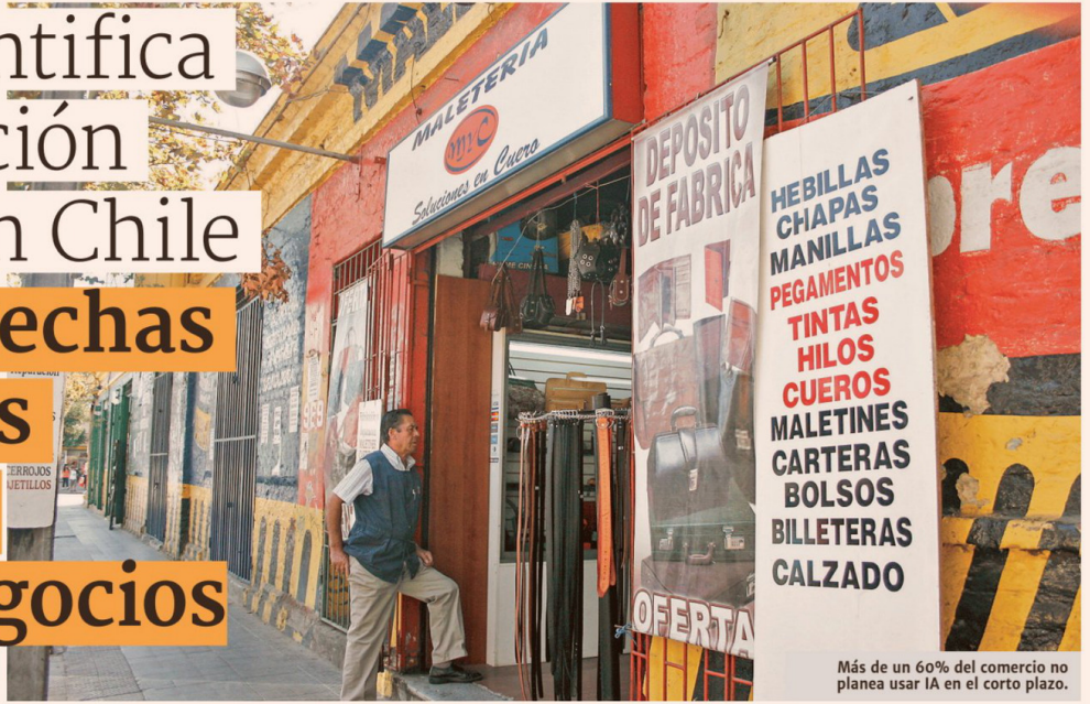
Más de un 60% del comercio no planea usar IA en el corto plazo.

■ Un estudio de la CNC observó que más de un 60% de las empresas de mayor tamaño tiene un nivel de digitalización alto, mientras que en las micro no supera el 40%. Lo mismo ocurre con el uso de IA y el acceso a tecnología.