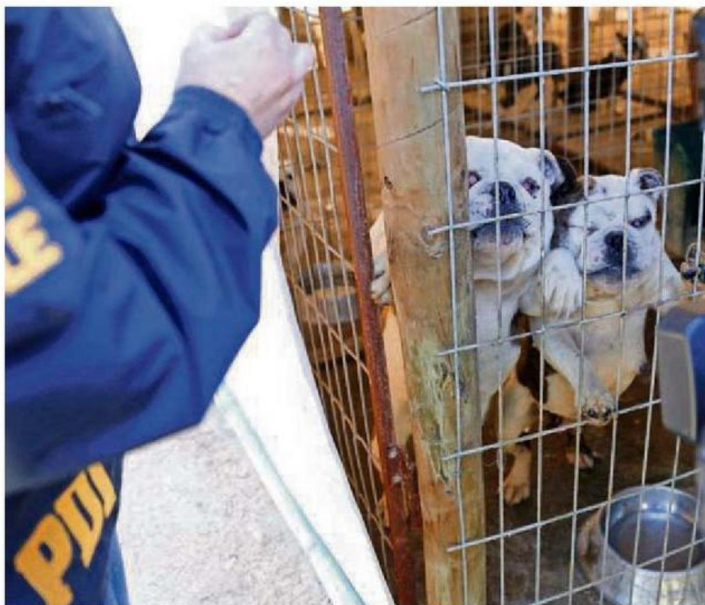
EL EQUIPO DE LA BIDEMA CUENTA CON EL APOYO DE UN OFICIAL VETERINARIO PARA ESTOS CASOS.

Respecto al comportamiento regional en torno a la tenencia responsable de mascotas y animales en general, el subprefecto Espinoza comenta que “lo que existe hoy es una mayor disposición a denunciar, pero curiosamente