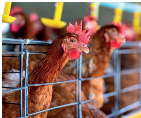
DECLARACIÓN DE ALERTA Preventiva en la región del Biobío – SENAPRED.