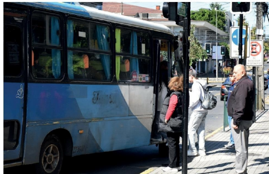
LOS CHOFERES DEL TRANSPORTE mayor también aspiran a mejorar sus condiciones.

"Esta semana nuestros socios están viendo la mejor marca para ingresar, así que en lo que queda de este año ya se empieza a notar un cambio para mejor en Los Ángeles", concluyó.