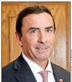
Fernando Rabat, ministro de Justicia.

Tras ello se dará una respuesta a Hacienda. Por ahora, la cartera solo ha tomado dos decisiones: ha planteado negarse a descontinuar el Programa de Derechos Humanos, pero sí la disposición a detener el programa PIL de intermediación laboral para jóvenes sancionados, pues correspondía al Sename y no se lo dio continuidad. Sin embargo, existen programas similares al PIL, que continúan en funcionamiento.