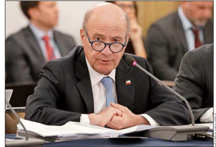
El ministro de Hacienda, Jorge Quiroz, liderará por parte del Gobierno la discusión del Presupuesto 2027.

continuar implica que el programa en su diseño actual no debe continuar operando”, señaló Quiroz en radio Infinita, citando el informe de la comisión asesora de reformas estructurales al gasto público que convocó el anterior Ejecutivo.