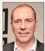
Louis de Grange, ministro de Transportes.

Para el Ministerio de Obras Públicas (MOP) Hacienda recomienda descontinuar el programa “Constitución, Registro, Fortalecimiento y Supervigilancia de Organizaciones de Usuarios” de la Dirección General de Aguas. Hasta el cierre de esta edición, el MOP no se había pronunciado por este tema.