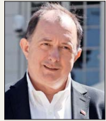
Iván Poduje, ministro de la Vivienda.

Según el programa, los talleres que ofrece buscan “fortalecer la autonomía económica como punto central para que mujeres impulsen su economía con la entrada al mercado laboral”.