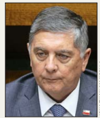
Claudio Alvarado, ministro del Interior.

En Cancelería , liderado por Francisco Pérez Mackenna , de diez iniciativas, dos figuran para ser descontinuadas: Fortalecimiento de la Política Consular - Migratorio y Especial de Responsabilidad Democrática y Feria Antártica Escolar, que entre ambos tienen la mayor carga económica, siendo su valor de $152,5 millones.