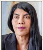
Ximena Lincolao, ministra de Ciencia.

En el Servicio Nacional del Patrimonio Cultural , la ex-Dibam, se sugiere descontinuar cuatro programas: Bibliomás (ex-Bibliometró); Biblioteca Pública Digital, Red digital de espacios patrimoniales (ex Red de Bibliotecas Públicas), y Sitios de patrimonio mundial.