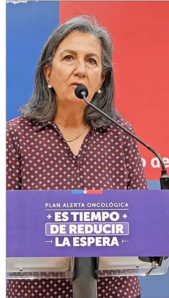
La ministra de Salud y otras autoridades de la cartera presentaron ayer el Plan de Alerta Oncológica.

La Corte no alcanzó a pronunciarse sobre la orden de no innovar, como solicitó la recurrente, antes de que el Servicio de Salud de Valparaíso y San Antonio procediera a designar un director subrogante, aunque aún está pendiente el proceso de selección de un nuevo titular en ese cargo.