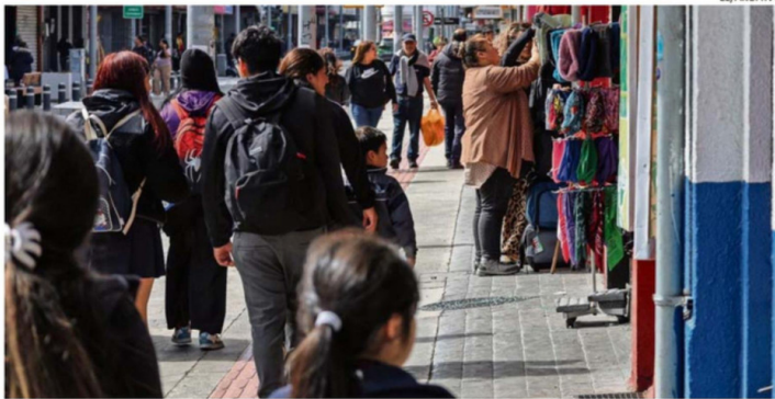
LOS DATOS OBTENIDOS EXPONEN UNA EVALUACIÓN SOBRE LA SITUACIÓN ECONÓMICA, EL MERCADO LABORAL Y LA SEGURIDAD PÚBLICA REGIONAL.

Un 44,9% de la población regional considera que la economía ha empeorado en el último año, mientras que un 40,2% estima que se ha mantenido igual, reveló la Novena Encuesta de Opinión Pública de la Región de Los Lagos que cada cuatro meses elaboran la Fundación Gente del Sur y la Facultad de Economía, Negocios y Gobierno de la Universidad San Sebastián (USS), mediante su Centro de Políticas Públicas.