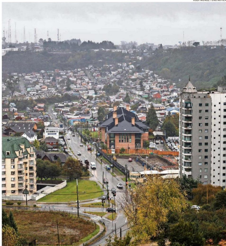
LOS DATOS OBTENIDOS EXPONEN UNA EVALUACIÓN SOBRE LA SITUACIÓN ECONÓMICA, EL MERCADO LABORAL Y LA SEGURIDAD PÚBLICA REGIONAL.

Sobre este fenómeno, Chandía argumentó que existe un "mercado laboral tensiona-