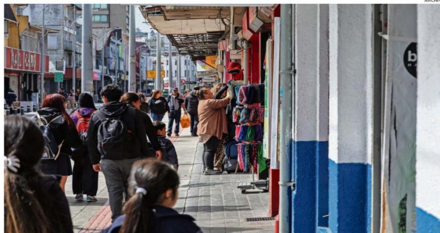
EXISTE UNA CRECIENTE PREOCUPACIÓN POR LA DIFICULTAD DE ENCONTRAR EMPLEO Y EL IMPACTO DEL ALZA EN LOS COMBUSTIBLES EN LOS HOGARES

“Estamos en una economía que no crece lo suficiente para mejorar estas percepciones”