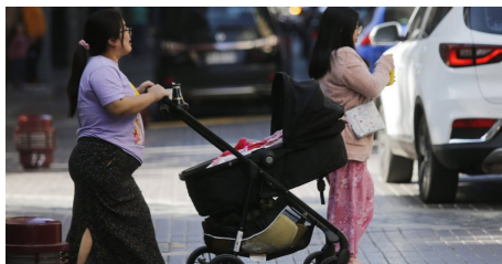
Hacienda recorta $32.721 millones a Desarrollo Social y afecta programas clave de Niñez e Indígenas