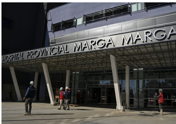
Hospital Provincial Marga Marga entra en tierra derecha: este jueves será entregado administrativamente al Servicio de Salud