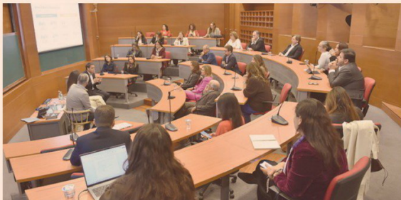
Asistentes a la presentación del estudio.