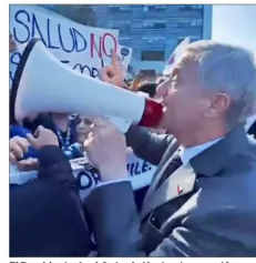
El Presidente José Antonio Kast usó un megáfono en Temuco para dialogar con manifestantes en el frente de un hospital, los que reclamaban contra eventuales rebajas presupuestarias en el sector de la salud.

COMISIÓN DE HACIENDA AFRENTA “EXIGENTE” TIMING POR PROYECTO DE RECONSTRUCCIÓN | B 1, C 2, C 3 y C 5