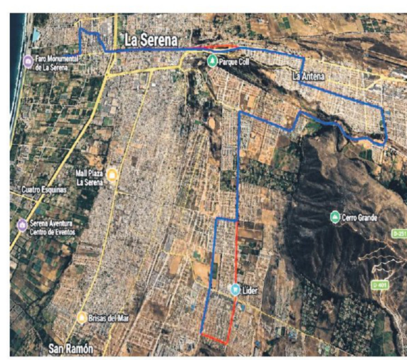
Servicio E06: El Faro - Puer-tas del Mar - Centro LA Serena - La Florida - Colina del Pino - Hospital La Serena