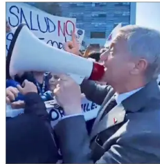
El Presidente José Antonio Kast usó un megáfono en Temuco para dialogar con manifestantes en el frente de un hospital, los que reclamaban contra eventuales rebajas presupuestarias en el sector de la salud.

COMISIÓN DE HACIENDA AFRONTA "EXIGENTE" TIMING POR PROYECTO DE RECONSTRUCCIÓN | B 1, C 2, C 3 y C 5