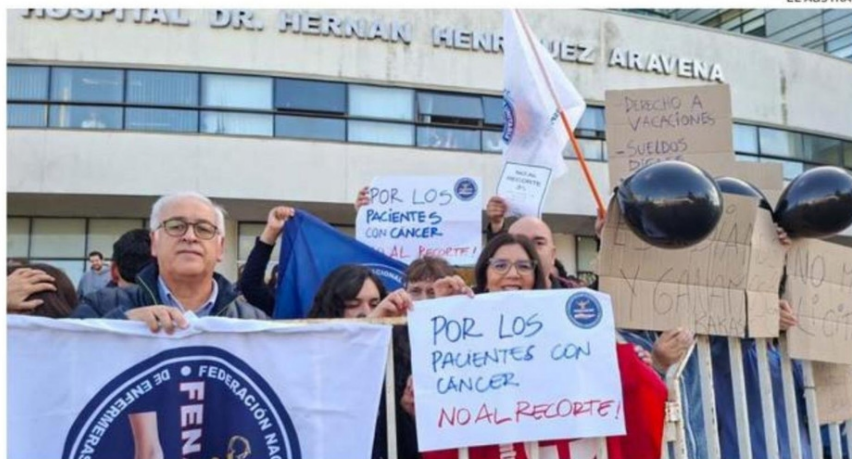
LA CUT, FENASenf, FENPRUSS Y LICITADOS SE MANIFESTARON. HUBO AGRADECIMIENTO POR GESTO DE KAST.