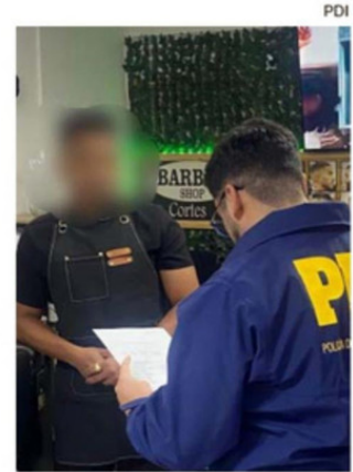
LAS FISCALIZACIONES FUERON REALIZADAS EN TEMUCO.