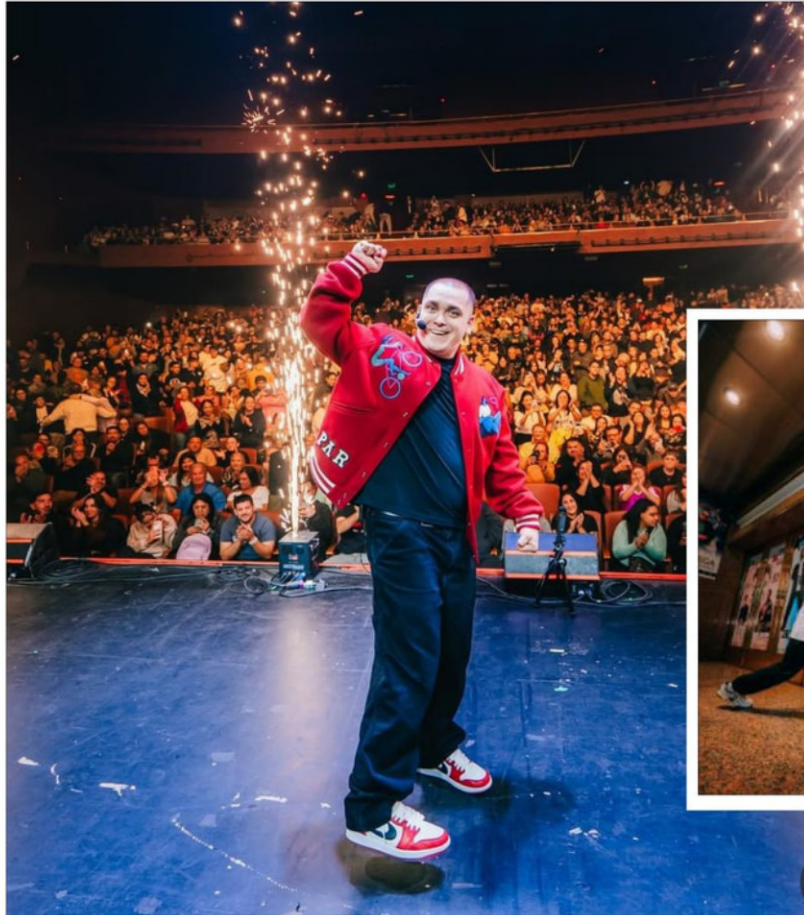
Miranda en el teatro Gran Rex.

"Hay chistes que cuando los dices en Chile escuchas un ooh y luego los ja-