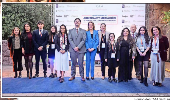
Equipo del CAM Santiago.