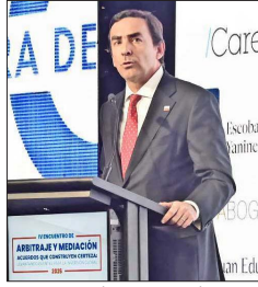
Ministro de Justicia y Derechos Humanos, Fernando Rabat.