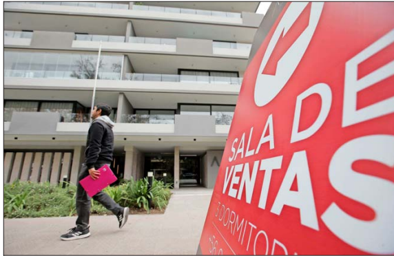
Según las cifras de Toctoc, la venta bruta de viviendas nuevas en el primer trimestre de 2026 en la RM llegó a 7.358 unidades, un alza de 9,4% anual.

En las cotizaciones de propiedades, el grupo etario más relevante son los millennials , mientras que por género lideran las mujeres, aunque luego tienen más dificultades para acceder a financiamiento.