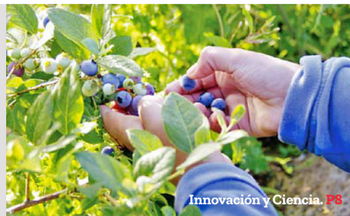
Innovación y Ciencia. P8

Buscan reemplazar colorantes sintéticos con pigmentos naturales de berries