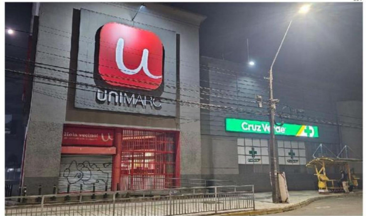
LOS LADRONES APROVECHARON QUE HABÍA UNA FALLA EN EL SISTEMA DE SEGURIDAD DEL SUPERMERCADO.

Al ser fiscalizado, señaló que no portar cédula de identidad y afirmó que se encontraba esperando locomoción colectiva para dirigirse a su domicilio. Sin embargo, sus dichos no resultaron creíbles, por lo que fue trasladado en un radiopatrulla hasta el cuartel para