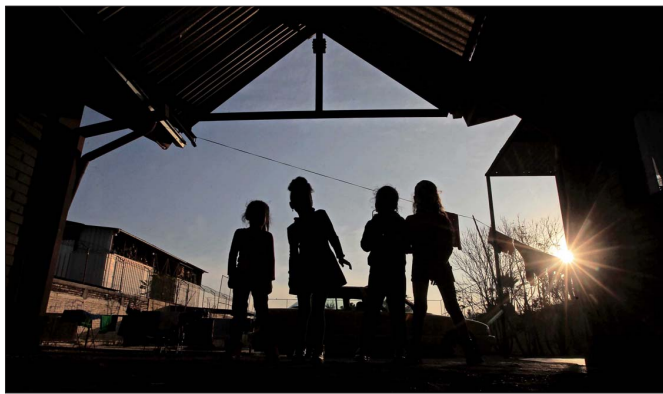
La comisión se creó a fines de 2024 y tiene por objetivo esclarecer las violaciones a los derechos humanos de niños y adolescentes bajo custodia del Sename o en sistemas de cuidados alternativos privados entre 1979 y 2024.

“No se trata de una discusión presupuestaria: cuando se desarticulan dispositivos especializados bajo criterios administrativos, se altera su sentido. Cuando se limita la autonomía de una Comisión de Verdad, se compromete gravemente su capacidad de cumplir su mandato”, precisan, aunque dicen confiar en que el Estado de Chile sa-