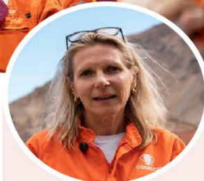
CLAUDIA GINTERSDORFER, embajadora de la Unión Europea en Chile.

"Las empresas de Países Bajos tienen mucho conocimiento que aportar al manejo sustentable del agua a la minería chilena".