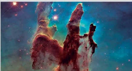
Esta imagen muestra los Pilares de la Creación en el centro de M16, la nebulosa del Águila.

estrellas jóvenes situado justo fuera del encuadre. Los vientos de estas estrellas están erosionando lentamente las torres de gas y polvo. Con una extensión de entre 4 y 5 años luz, los Pilares de la Creación son una característica fascinante, pero relativamente pequeña, de toda la Nebulosa del Águila, que abarca 70 por 55 años luz. La nebulosa, descubierta en 1745 por el astrónomo suizo Jean-Philippe Loys de Chéseaux, se encuentra a 7000 años luz de la Tierra, en la constelación de Serpens. Con una magnitud aparente de 6, la Nebulosa del Águila puede observarse con