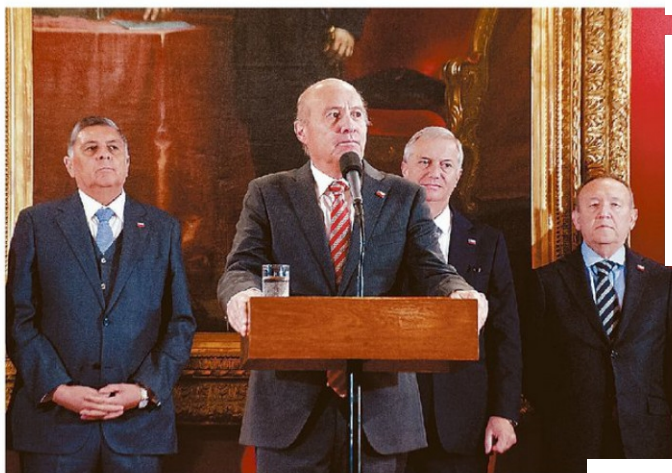
LA FALTA DE COORDINACIÓN INTERMINISTERIAL SE TRADUCE EN MENSAJES CONTRADICTORIOS.

¿Influye en esta lectura que los ministros sean más técnicos que políticos? "Naturalmente era un riesgo al que apostaba Kast a la hora de nombrarlos. Cuando en enero conocimos los nombres de los ministros y ministras, buena parte de estos eran indepe-