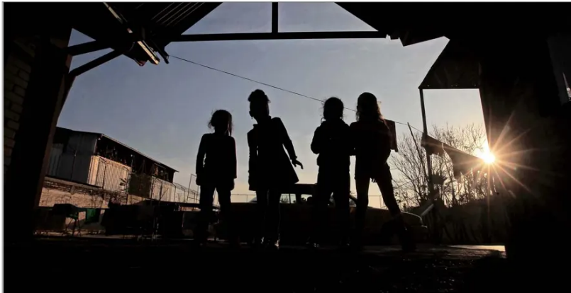
La comisión se creó a fines de 2024 y tiene por objetivo esclarecer las violaciones a los derechos humanos de niños y adolescentes bajo custodia del Sename o en sistemas de cuidados alternativos privados entre 1979 y 2024.

“No se trata de una discusión presupuestaria: cuando se desarticulan dispositivos especializados bajo criterios administrativos, se altera su sentido. Cuando se limita la autonomía de una Comisión de Verdad, se compromete grave-