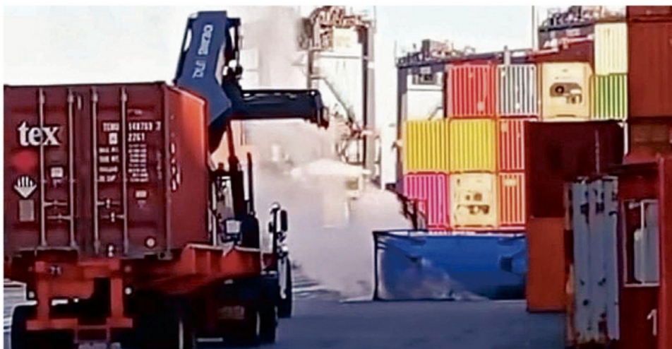
LA EMERGENCIA SE REGISTRÓ A LAS 17.13 HORAS DE AYER EN EL SITIO DEL PUERTO.

Por causas que están siendo investigadas por la Armada, un camión retiró dos tanktainer (contenedor diseñado para transportar