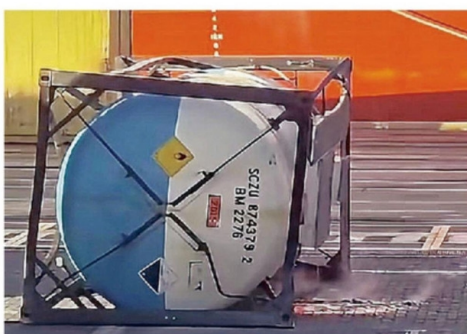
EL TANKTAINER CAYÓ DESDE UN CAMIÓN.