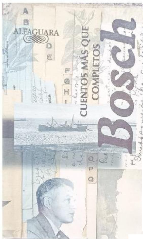
Portada de la primera edición del libro que recrea la estadia del autor dominicano en nuestro país entre 1955 y 1956.

A menudo se asocia a Juan Bosch con ideas marxistas, de hecho durante buena parte de su vida colaboradores y adversarios lo tildaron de comunista, afirmación que cada cierto tiempo salía a desmentir.