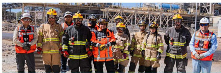
El apoyo de bomberos contribuye a una rápida reacción ante emergencias.

emergencias, asegurando un entorno más seguro tanto para quienes participaron en las labores como para la comunidad.